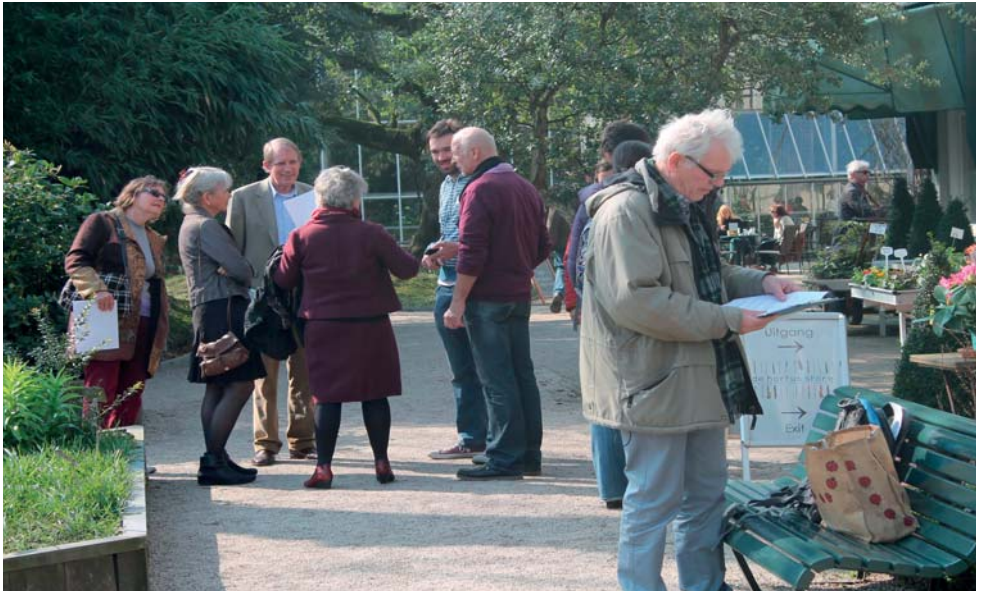
De deelnemers aan de proeftuin aan het werk in de Hortus van de Universiteit van Amsterdam.

Utrecht, de botanische tuin in Oudendbosch en de Hortus van de Universiteit van Amsterdam kwamen de vertegenwoordigers van de tuinen bij elkaar. Door middel van het uitwisselen van ervaringen, brainstormen, maar ook door het daadwerkelijk benaderen van de doelgroepen onderzochten zij de verschillende opties. Voorbeelden van die doelgroepen waren (groot)ouders met kinderen, stadstuiniers, 70-plussers en toeristen. Speciale aandacht ging daarbij uit naar het gebruik van de sociale media. De resultaten van de proeftuin zullen in de komende maanden worden uitgewerkt.