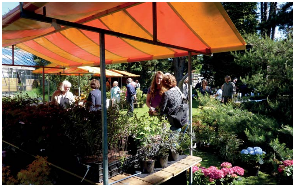
Stoer in de Schaduw, met een ruime keus aan schaduwplanten.