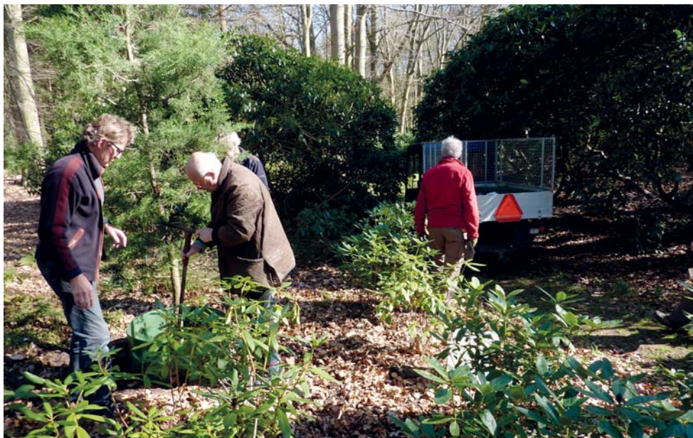
Bomen uit het Pinetum worden geplant op Gooilust.

Per coniferenfamilie proberen we de helft van de in de wereld voorkomende soorten onder te brengen, met de nadruk op bedreigde exemplaren. We streven er bijvoorbeeld niet naar alle soorten dennen (geslacht Pinus ) te verzamelen. Bestuurslid Jan Wolff heeft hiervoor een plan opgesteld.